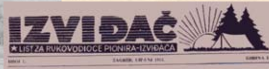
Prvi broj lista „Izviđač“, lipanj 1951. godine