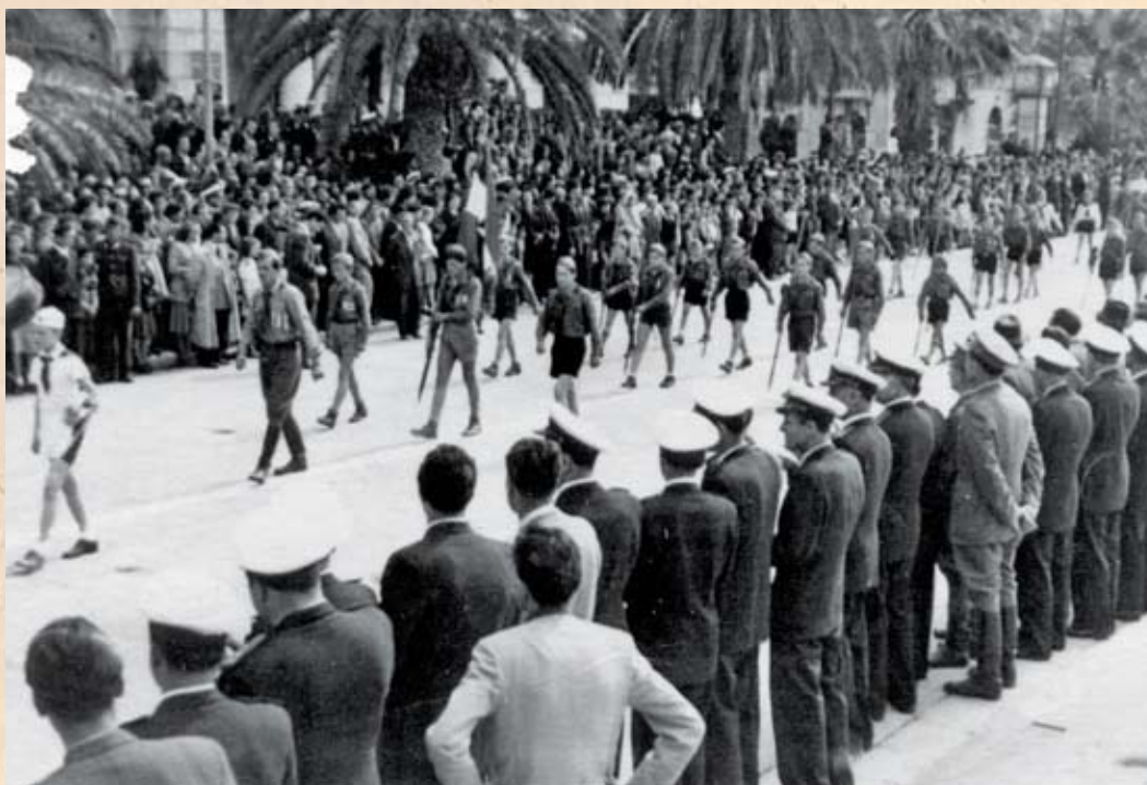
Prvi javni nastup izviđača u odorama na splitskoj Rivi 1. svibnja 1951. godine

N akon rata promijenjene su političke okolnosti u novoj Jugoslaviji te je 1946. godine službeno zabranjen rad skauta u Hrvatskoj. Premda se formalno u petogodišnjem poslijeratnom razdoblju nije obnovila predratna organizacija, potreba za skautskim aktivnostima boravka i učenja djece u prirodi bila je očita.