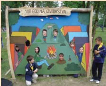
Na Zborovanju SIH-a na zagrebačkom Bundeku 2007. godine