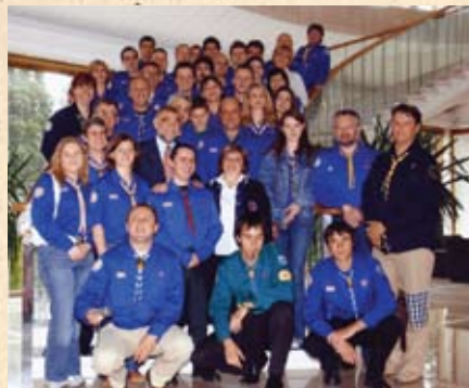
Na primanju kod predsjednika Mesića prigodom Dana izviđača 2005.